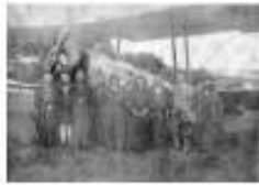
3) デジカメで失敗して暗くなった写真の修正