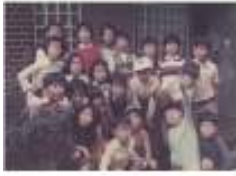
1) 褪色したカラー写真の色修正・復元

ってイイものです。昔の思い出が瞬時に蘇ります。そして「この着物はとってもきれいだったのよ」とか「この風景はとっても感動的だった」など、同時にその時の情景を鮮明に思い出しているものです。